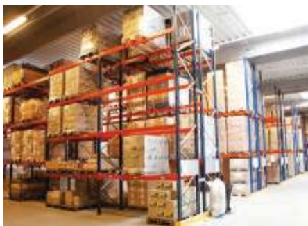
Постоянный товарный запас